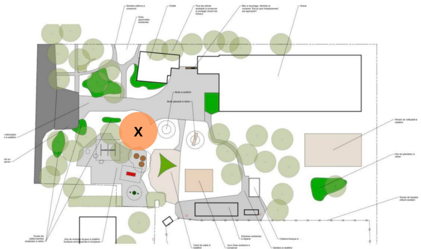
Crédits : Stéphanie Desmeules, Paysages spirituels et thérapeutiques, et Katerine Boisclair

L'aire du parc est principalement gazonnée (sauf dans les sections de jeux et dans l'allée d'accès au Toit des Quatre-Temps) et des arbres feuillus et conifères matures ponctuent l'espace et délimitent les différentes sections du parc. Un stationnement situé en bordure de la route délimite le parc d'un côté et les bâtiments et terrains sportifs de l'autre. Des bancs et des tables à pique-nique composent le reste de l'aménagement actuel du parc.