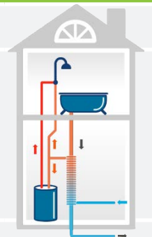
La chaleur des eaux utilisées préchauffe l'eau froide